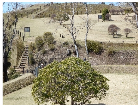
天守台からの眺め

本丸から二の丸の間に架かる木橋は、いざという時に木橋を堀に落とし、本丸への敵軍の侵入を防ぎます(写真上左)。写真上右は天守台から本丸、二の丸方向の景観です。